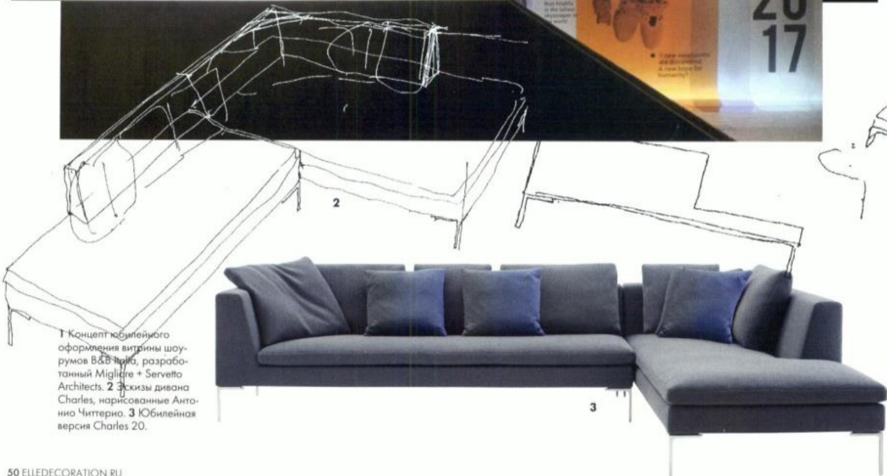
1 Концепт юбилейного оформления витрины шоу-румов B&B Italia, разработанный Migliore + Servetto Architects. 2 Эскизы дивана Charles, нарисованные Антонио Читтернио. 3 Юбилейная версия Charles 20.